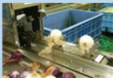
▲ 農産物処理加工施設